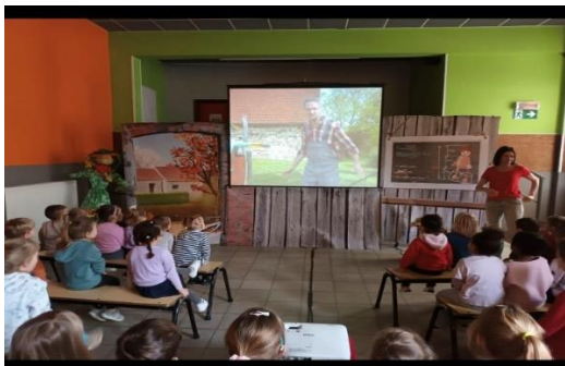
Spectacle planète Mômes pour les maternelles et P1